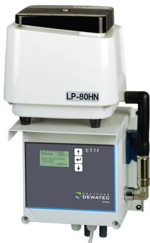
Aggregatkonsole für den wettergeschützten Innenbereich

Wetterfeste Freiluftsäule für den Einsatz im Außenbereich