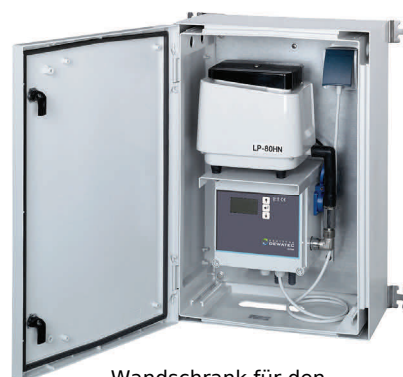
Wandschrank für den Innen- und Außenbereich