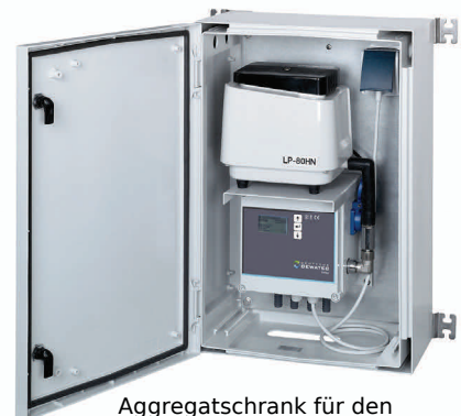
Aggregatschrank für den Innen- und Außenbereich