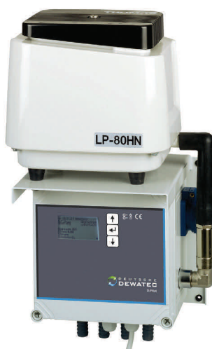
Aggregatkonsole für den wettergeschützten Innenbereich

Wetterfester Schaltschrank für den Einsatz im Außenbereich